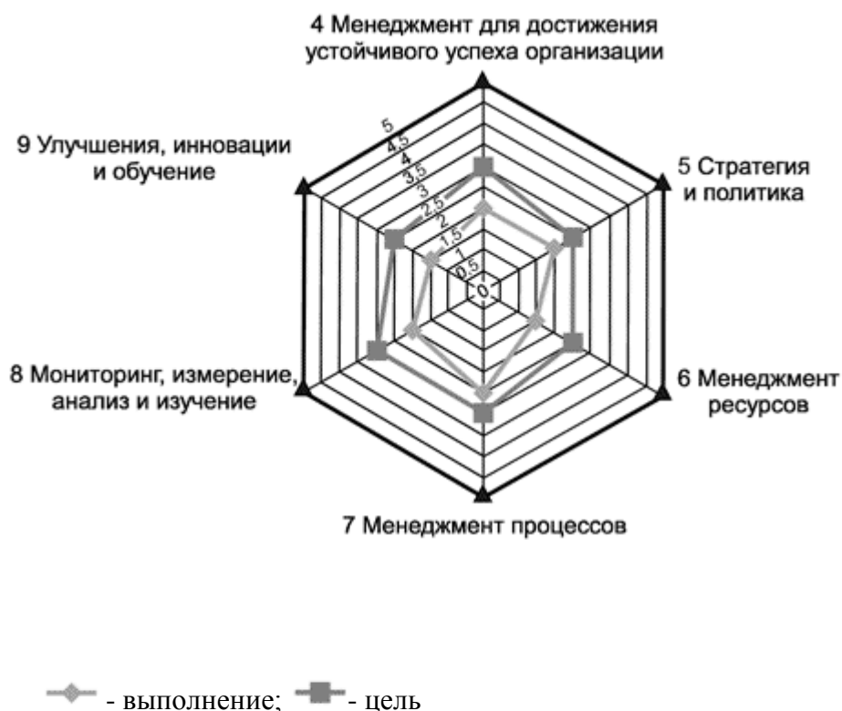
Рисунок А.2 - Иллюстрация результатов самооценки

Организация может характеризоваться разными уровнями зрелости по каждому из элементов. Анализ расхождений может помочь высшему руководству в планировании и определении первоочередных мер по улучшению и (или) инновационных инициатив, необходимых для перевода отдельных элементов на более высокий уровень.